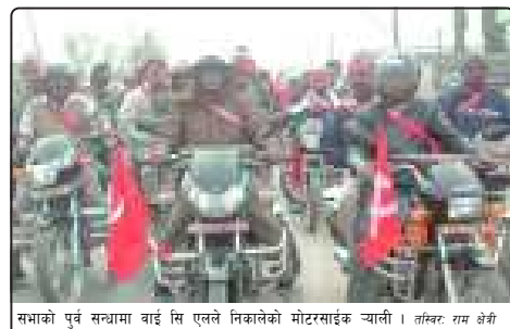
सभाको पूर्व सन्ध्यामा बाई सिपलले निकालेको मोटरसाइकल चाली ।

■ कृपा संवाददाता — वीरगंज, १० माघ / सात दलीय गठबन्धनको सरकारले आयोजना गरेको संयुक्त चुनावी सभालाई सफल बनाउनका लागि माओवादी निकटको बाई सिपलले मोटरसाइकल चाली निकालेको छ । विहीवार सदरमुकाम वीरगंजबाट निस्किएको सो मोटरसाइकल चाली जिल्लाको दुर्गम गाविस टोरीमा पुगी अन्त्य हुने बताइएको छ । यही माघ १२ गते वीरगंजमा आयोजना गरिएको चुनावी सभालाई लक्षित गरी यसरी बाई सिपलले मोटरसाइकल चालीको आयोजना गरेको हो । यसैबीच सात दलले